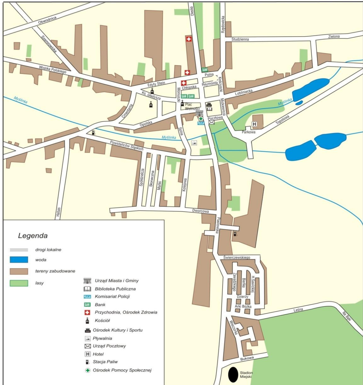
Rysunek 2. Położenie miasta Dobrodzień.