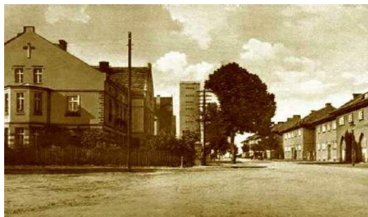
Rysunek 3. Ulica Oleska około roku 1936. Po lewej budynek szpitala w Dobrodzieniu.

Z inicjatywy saksońskiej królowej Karoli wybudowano w Dobrodzieniu w 1898 r. nowy szpital, który na cześć „anioła ubogich” nazwano „Zakładem królowej Karoli”. W 1919 r. król Fryderyk August sprzedał część dóbr państwu i osobom prywatnym, a na podstawie prawa pruskiego z 27 grudnia 1927 r. majątek dobrodzieński został nabyty przez państwo niemieckie. Dla uczczenia mężczyzn, poległych w I wojnie światowej w latach 1914 – 1918, miasto ufundowało pomnik z brązu (zachowany jedynie na fotografiach).