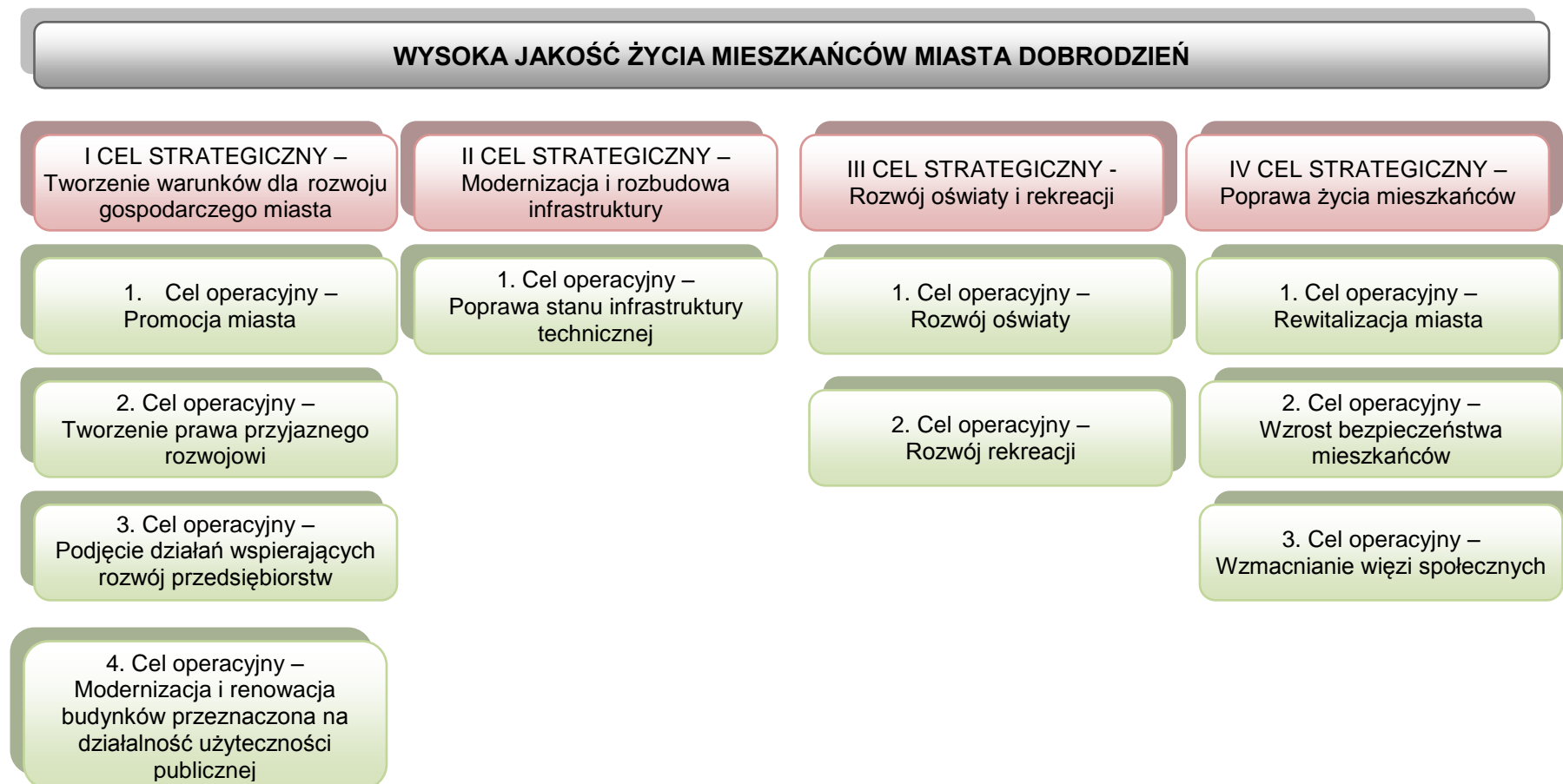
Tabela 4. Wyznaczone cele strategiczne dla miasta Dobrodzienia.